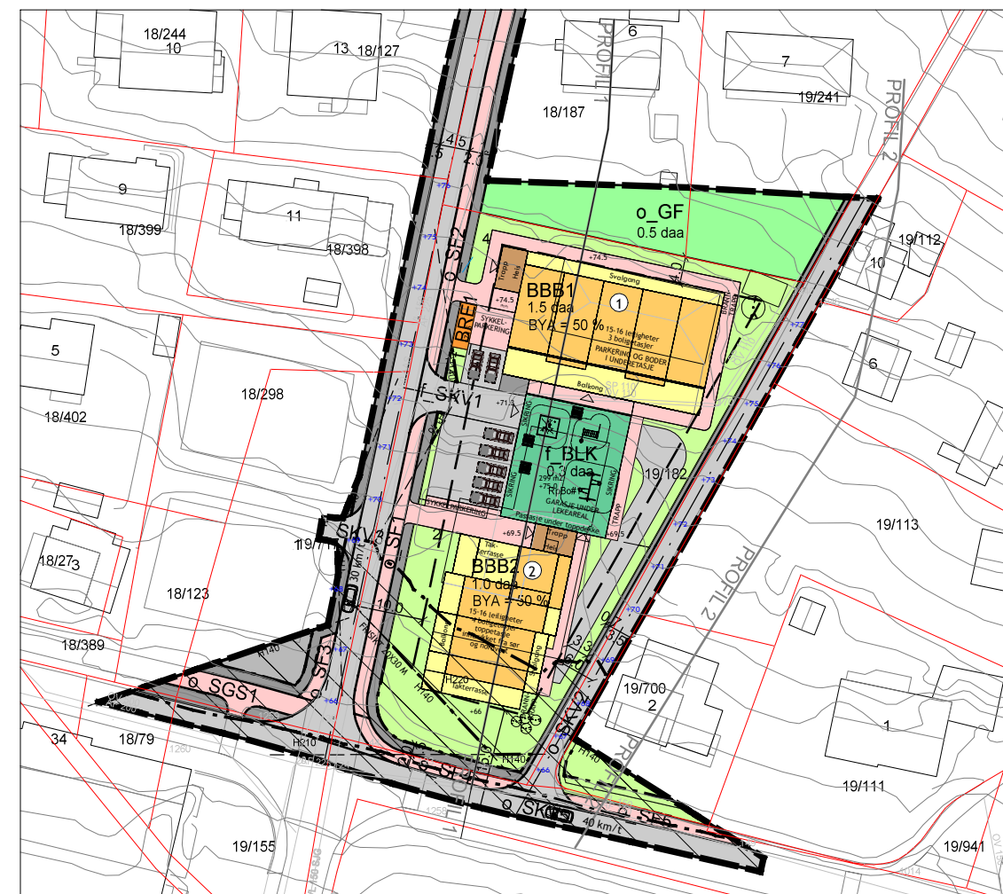
(ALTERNATIV B DERSOM DET ER BEHOV FOR PARKERING I UNDERETASJEN PÅ BYGG 2)

Rev. C 22.01.20 - Just. bygg sør, lekeplass mhs Rev. B 10.01.20 - Justert bygninger mhs Rev. A 03.10.19 - Sammenstilling profil 1 og 2 mhs