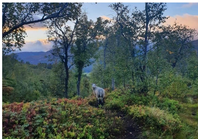
Sau på beite i Hornindal

For slakteproduksjon på svin er det viktig at du set kryss for at opplysningar kan hentast frå slakteria sine rapportar, elles får ein ikkje grunnlag for avløyising og tilskot på slaktegrisproduksjonen.