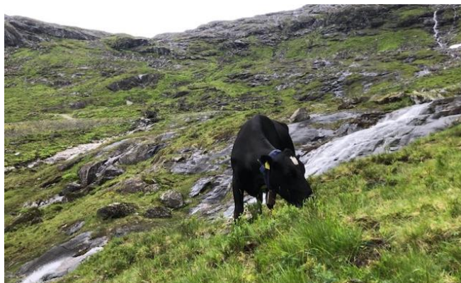
Ku på utmarksbeite i Litledalen

Lenke til gardskart: https://gardskart.nibio.no/search