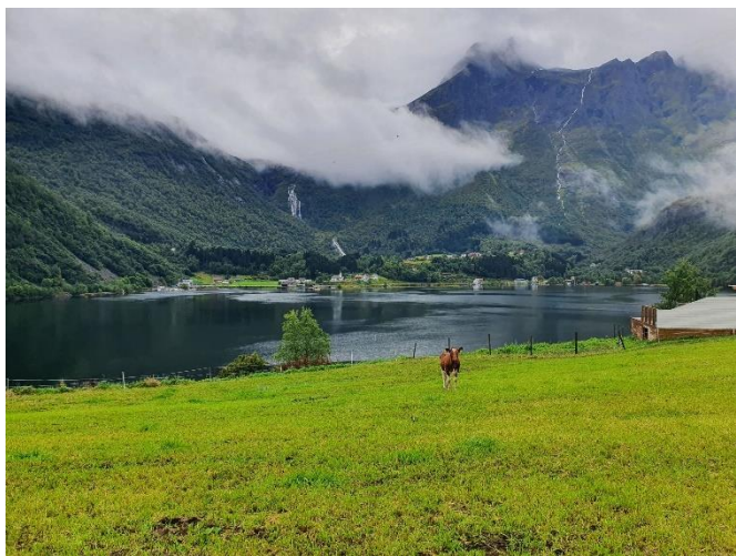
Ungdyr på beite på Bjørke

Ekstrautbetalingane i september utgjorde til saman kr 10.794.782 for Ørsta og Volda.