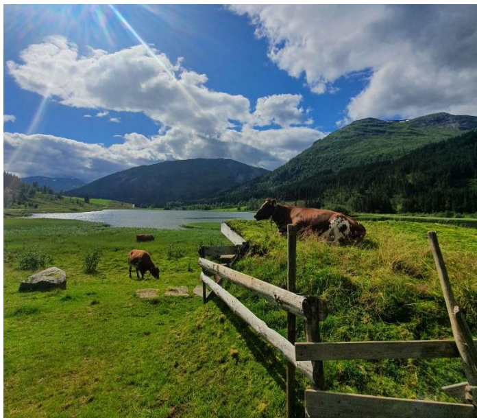
Kyr som slapper av på setervollen, tatt i Jølster

Dersom ein vil ha RMP-tilskotet til tidleg spreieing må all gjødsla vere spreidd innan 17. august.